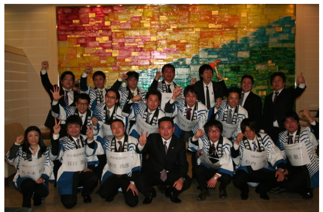
2012年度会員研修委員会